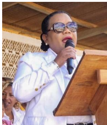
Mme RASOLOARISOA Marie Marcelline, Ministre de l'Enseignement Technique et de la Formation Professionnelle

Votre contribution est essentielle. Nous vous souhaitons plein succès dans vos actions, qui occupent une place majeure dans le développement de Madagascar.