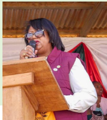
Mme RAKOTONDROSOA Annie Franckline Gouverneure de la région Ihorombe

Dans son allocution, Madame la Ministre a tenu à féliciter Fert, Fifata et Cap Malagasy pour les efforts remarquables qu'ils consacrent au développement du monde rural au cours de ces 20 années. Elle a souligné que de telles initiatives constituent un levier stratégique pour Madagascar, dans la mesure où toute politique de développement durable doit nécessairement s'ancre dans l'agriculture et l'élevage. L'action menée par Cap Malagasy en offre une illustration tangible : en appuyant directement les producteurs agricoles, qui assurent la sécurité alimentaire de millions de Malgaches, le programme participe activement à la construction d'un développement national inclusif et pérenne.