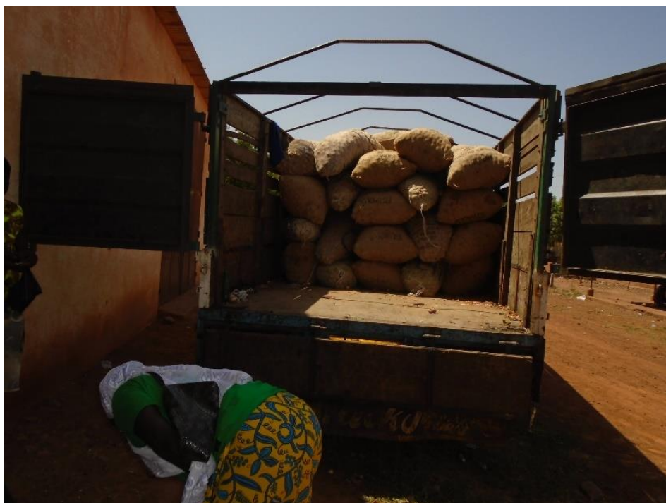
Chargement d'oignons au comptoir de Kongoussi

En outre, le comptoir principal est aujourd'hui occupé par les personnes déplacées internes (PDI) qui ont fui les exactions terroristes et qui n'ont pas encore d'abri. Les familles membres de l'Upcom ont dû réaliser des dépenses supplémentaires en prenant en charge ces PDI avant que les ONG ne prennent le relais. En raison de ces coûts additionnels, ces familles membres de l'Upcom sont devenues des familles vulnérables et ont vu leur taux de pauvreté augmenter ces deux dernières années.