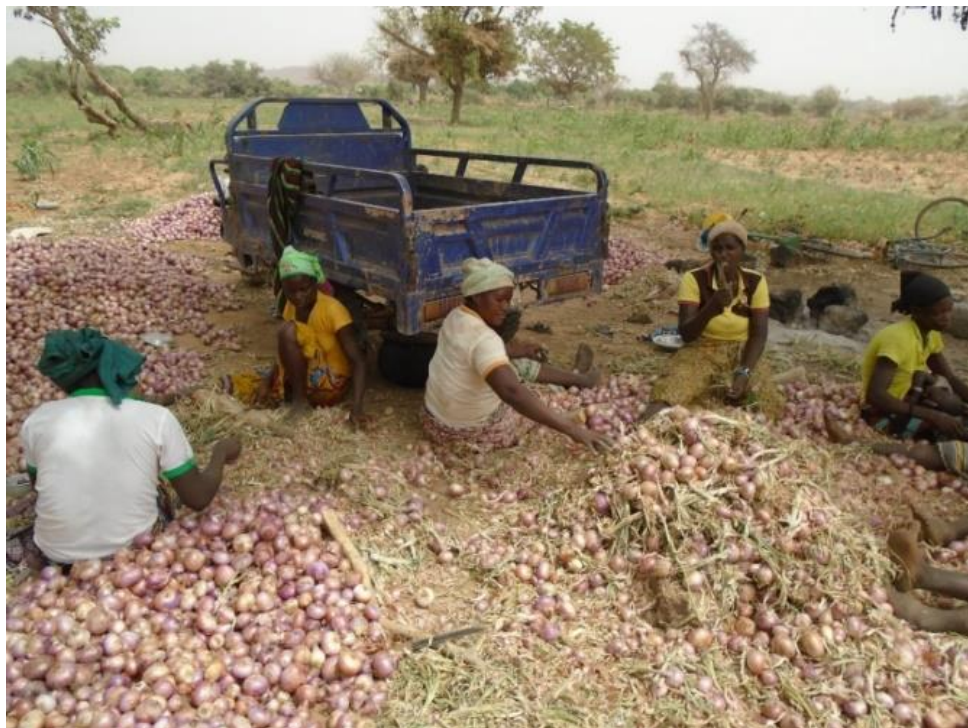
Récolte des champs-école à Bourzanga

Aujourd'hui, comme il y a une baisse de la production dans le pays du fait de l'insécurité, et des changements climatiques, les prix ne chutent pas et les producteurs non membres de l'Union continuent à vendre bord-champ, étant donné, que certains comptoirs sont pratiquement à l'arrêt (Bourzanga et Zimtanga).