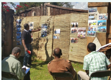
Madagascar: atelier de restitution d'une visite d'échanges