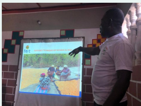
Côte d'Ivoire: restitution sur les parcelles de démonstration maïs