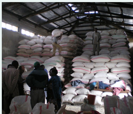
Tanzanie – Stockage du maïs