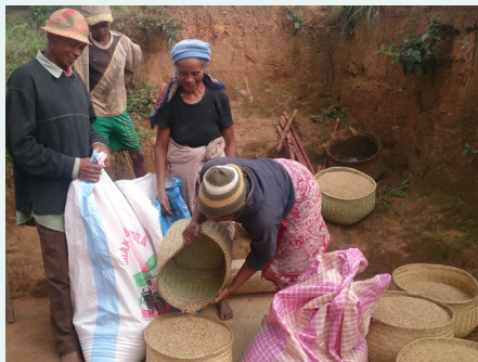
Madagascar – Remplissage des sacs