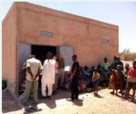
Burkina Faso – Magasin de stockage de proximité