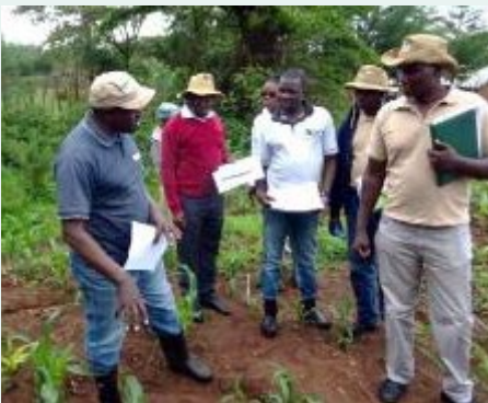
Kenya – visite d'échanges dans les champs