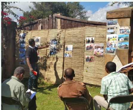
Madagascar – Atelier de restitution d'une visite d'échange