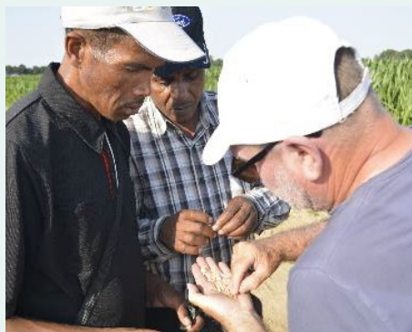
France – visite d'échange avec Ceffel